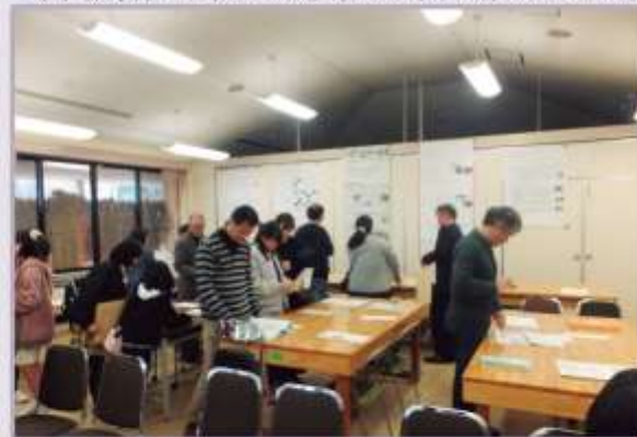
会場に展示された受賞作品を自由に見てまわりました。