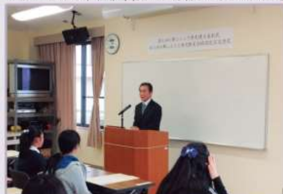
井手委員長より第6回応募作品の講評が行われました。