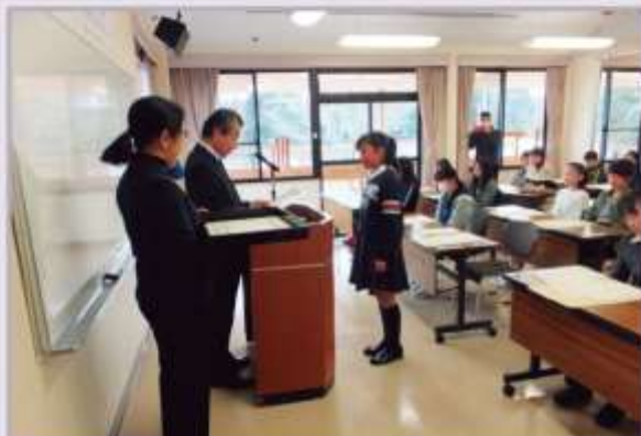
受賞した皆さんに教育長より表彰状が手渡されました。

日時：2019年1月19日（土）14時00分～ 場所：小郡市埋蔵文化財調査センター 研修室