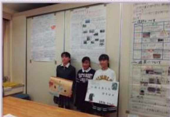
大賞・優秀賞作品と一緒に記念撮影をしました。