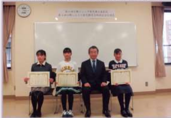
受賞された皆さん、本当におめでとうございます！