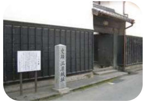
たちあらいまちほんごう みほらじやうあと 大刀洗町本郷にある三原城跡

問題 20 み い み ほらぐん おおとも し くさの し 御井・御原郡には、大友氏、草野氏、 ちくしし ぐんがい ほんきよち も りやうしゆ しよ 筑紫氏など郡外に本拠地を持つ領主の所 りやう 領もありました。そのうち筑紫氏は、せんごく 時代には ひ ぜんのくに や ぐん かつのおじやう さ が けん 時代には肥前国養父郡の勝尾城（佐賀県 と す し きよじやう しよりやう いち ぶ 鳥栖市）を居城とし、その所領の一部は、 おごおり し いきない およ おごおり し 小郡市域内にも及んでいました。小郡市 しもにしあじさか ちくし し か しん きよじやう つた 下西鱒坂には筑紫氏家臣の居城と伝わる しろあと 城址がありますが、何という城の跡でしょう。