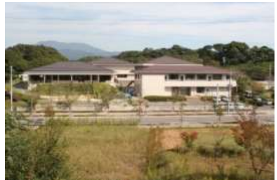
小郡市埋蔵文化財調査センター (古代体験館おごおり)

問題 45 右下の写真は、火であぶった魚を藁に刺した保存食ですが、これの名前は何かというでしょう。