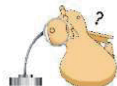
埋文センター イメージキャラクター「つこっこ」

古墳のいろんな「ひみつ」をしらべたら、 もぞうしやノートに、絵や写真といっしょにまとめて、 〈ジュニア歴史博士〉におうぼしてみよう！ くわしくは、埋蔵文化財調査センターホームページで！